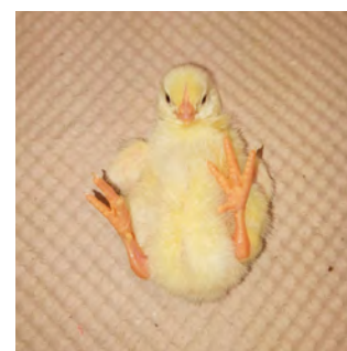
Fig. 4 – Actividad

>> Un pollito de buena calidad se percibe principalmente por su actividad, su andar, la ausencia de anomalías respiratorias y un omblogo cicatrizado apropiadamente.