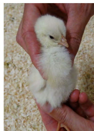
Fig. 7 – Buche lleno, blando y redondeado

>> Ocho horas después del alojamiento al menos el 80 % de los pollitos debe tener su buche lleno de alimento y agua (Fig. 7). Esto debe incrementarse hasta el 96 % alrededor de las 24 horas después de alojar. Si no, revise la disponibilidad del alimento, su calidad y el suministro de agua y las condiciones de cría (temperatura, intensidad de luz, calidad del pollito...).