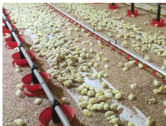
Fig. 6 – Alimentación sobre papel al arranque

>> El agua es muy importante ya que las aves pueden beber 1,6 a 2 veces lo que comen, dependiendo de la edad y sistema de bebederos.