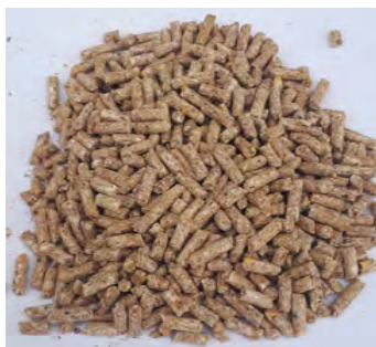
Fig. 9 – Buen granulo