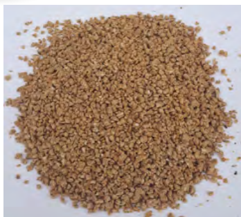
Fig. 8 – Migaja estándar