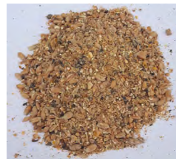
Fig. 10 – Harina grosera