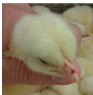
Fig. 2 – Punto rojo