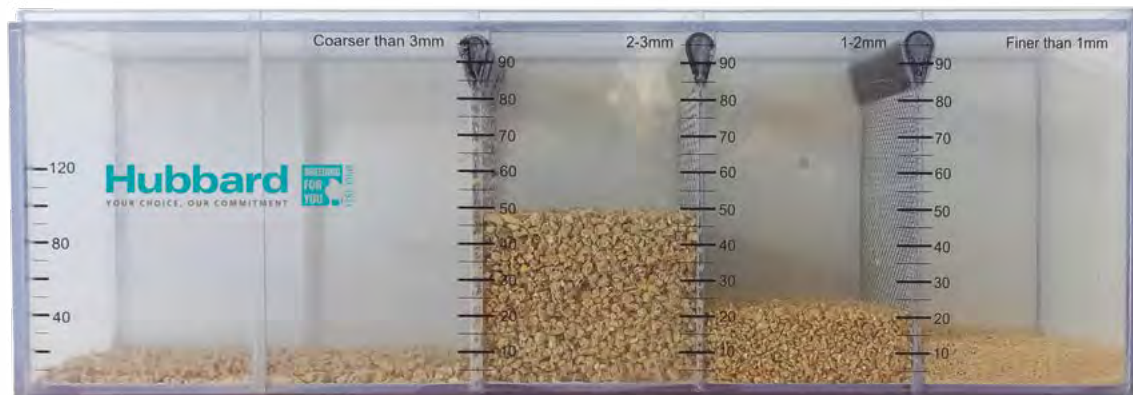
料斗中破碎料的外观品质：正确的粒径